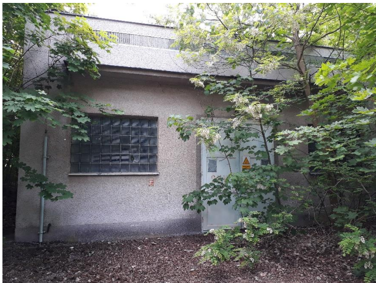
Čelní pohled na objekt