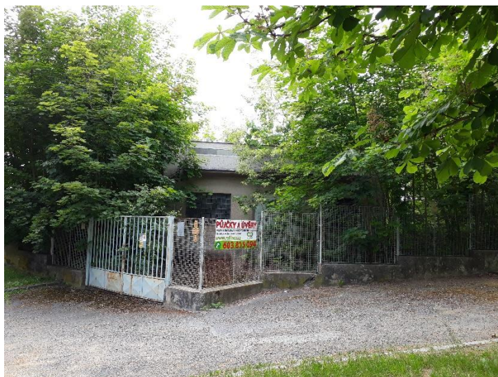
Pohled na pozemek z ulice Prokopa Velikého